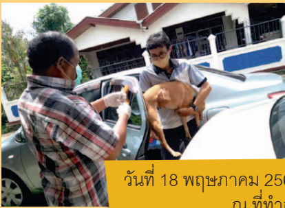
วันที่ 18 พฤษภาคม 2563 บริเวณชุมชนควนขนุน ณ ที่ทำการชุมชน