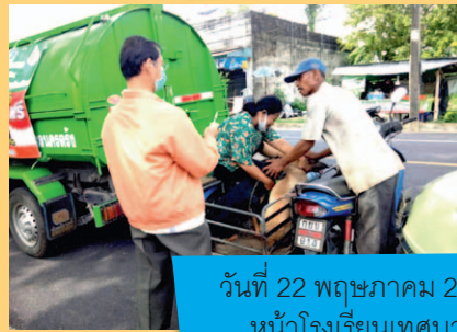
วันที่ 22 พฤษภาคม 2563 บริเวณชุมชนน้ำผุด หน้าโรงเรียนเทศบาล 6 (วัดตันตยาภิรม)