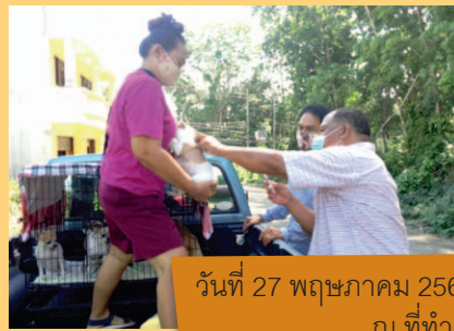
วันที่ 27 พฤษภาคม 2563 บริเวณชุมชนหนองปรือ ณ ที่ทำการชุมชน