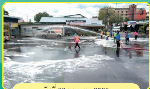
วันที่ 21 เมษายน 2563 ล้างทำความสะอาด บริเวณถนนรื่นรมย์