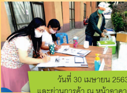
วันที่ 30 เมษายน 2563 บริเวณชุมชนตรอกปลา และย่านการค้า ณ หน้าอาคารอเนกประสงค์เทศบาลนครตรัง