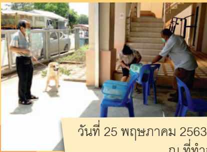
วันที่ 25 พฤษภาคม 2563 บริเวณชุมชนหลังควนหาญ ณ ที่ทำการชุมชน