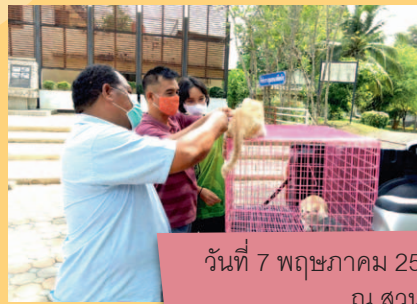
วันที่ 7 พฤษภาคม 2563 บริเวณชุมชนศรีตรัง ณ สวนทับเที่ยง