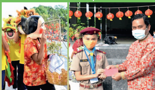
วันที่ 11 กุมภาพันธ์ 2564 จัดกิจกรรมวันตรุษจีน เพื่อให้นักเรียนได้ศึกษาวัฒนธรรมประเพณีที่ตีมามส่งเสริมสร้างความรู้ภาษาจีนสอดแทรกในทุกกิจกรรม ณ บริเวณหน้าเสาธง