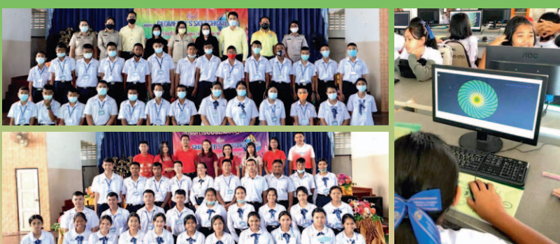
ระหว่างวันที่ 8-11 กุมภาพันธ์ 2564 จัดโครงการอบรมเชิงปฏิบัติการโปรแกรม Geometer's Sketchpad (GSP) แก่แก่นักเรียนระดับชั้นม.1 และ ม.4 เพื่อสนับสนุน ส่งเสริมให้นักเรียนสามารถเรียนรู้ทักษะและวิธีการคิดผ่านการใช้โปรแกรม