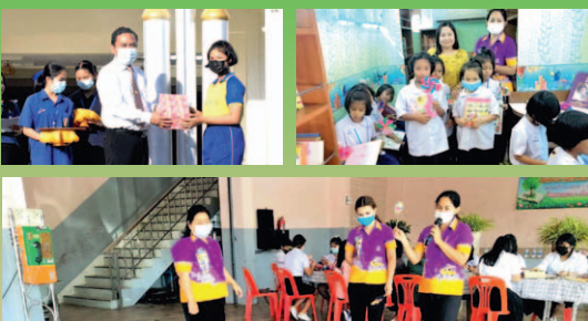
ระหว่างวันที่ 25 มกราคม - 3 กุมภาพันธ์ 2564 จัดโครงการสัปดาห์ห้องสมุดประจำปีการศึกษา 2563 เพื่อส่งเสริมและสนับสนุนให้นักเรียนได้รู้จักการใช้เวลาว่างให้เป็นประโยชน์ มีนิสัยรักการอ่าน รู้จักศึกษาค้นคว้าด้วยตัวเอง