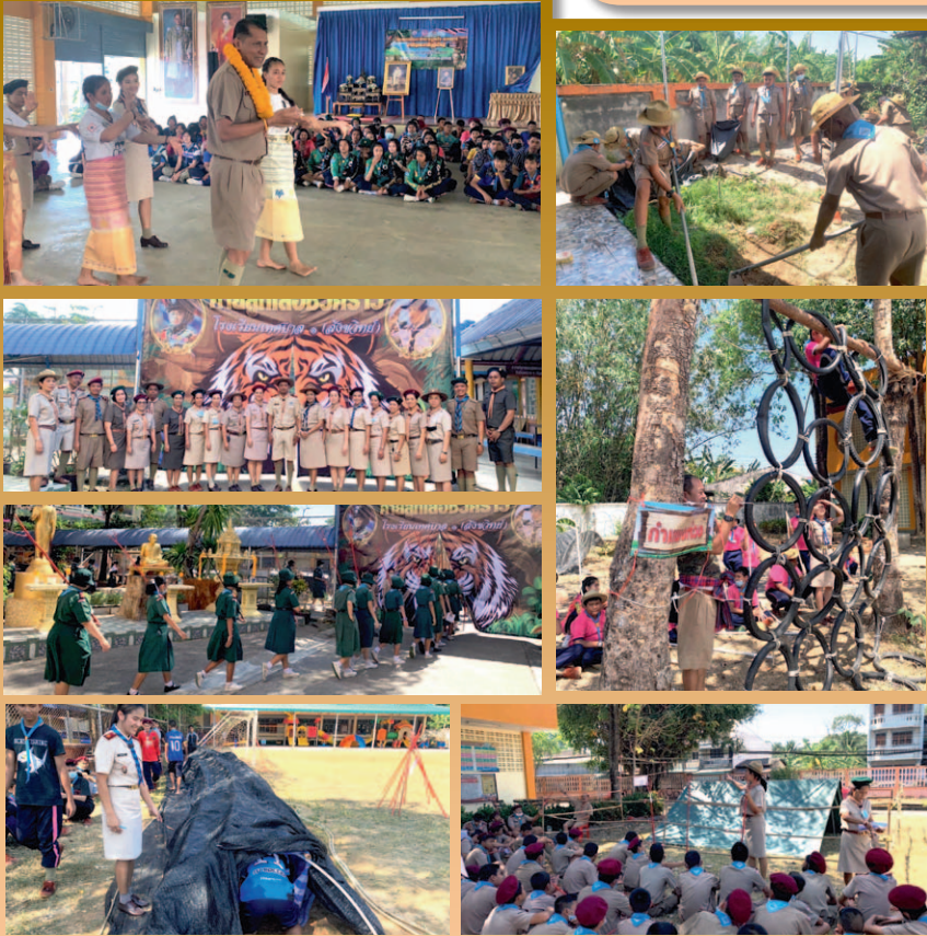
วันที่ 24 - 25 กุมภาพันธ์ 2564 จัดโครงการพัฒนาทักษะลูกเสือ - เนตรนารีสามัญและสามัญรุ่นใหญ่ ประจำปีการศึกษา 2563 ณ ค่ายลูกเสือชั่วคราว โรงเรียนเทศบาล ๑ (สังขวิทย์)