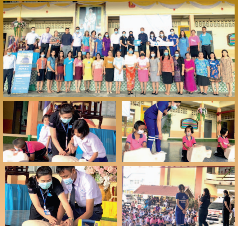
ขอขอบคุณโรงพยาบาลวัฒนแพทย์ตรัง ที่ให้ความอนุเคราะห์บุคลากรที่มีความรู้ ความเชี่ยวชาญมาให้ความรู้ สาธิตและให้นักเรียนได้เรียนรู้และลงมือปฏิบัติจริง การช่วยฟื้นคืนชีพ (CPR) ผู้ป่วยที่หัวใจหยุดเต้นกะทันหันอย่างถูกวิธี