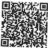
เอกสารแนบ