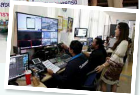
สถานีโทรทัศน์ช่องฟ้าวันใหม่