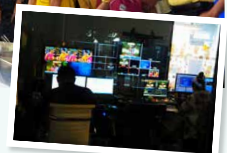
บริษัท เอไอเอ็ม มีเดีย (ดีก GMM Grammy) และช่อง One HD