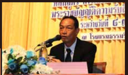
เรื่องเด่นนครตรัง อบรมสัมมนาเพิ่มศักยภาพบุคลากร เสริมสร้างความรู้ความเข้าใจพระราชนิพนธ์ ความรับผิดชอบทางละเมิดของเจ้าหน้าที่