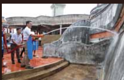
เรื่องเด่นนครตรัง รทท.กระทรวงท่องเที่ยวและกีฬา ร่วมพัฒนาเขาหนองยวน