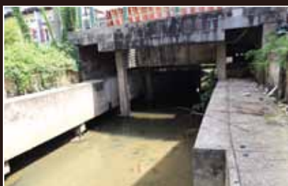
เรื่องเด่นนครตรัง นครตรังสำรวจคลองห้วยยาง วางแผนป้องกันน้ำท่วม