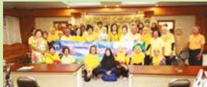
24 กรกฎาคม 2562 องค์การบริหารส่วนตำบลกมลา จ.ภูเก็ต