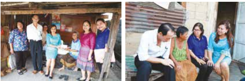
วันที่ 6 กันยายน 2562 ชุมชนควนงู้น ควนจัน และโคกยุง