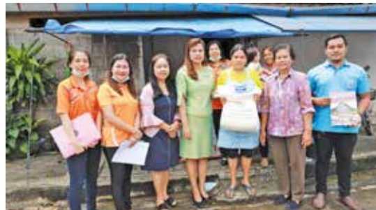
วันที่ 25 กันยายน 2562 ชุมชนบางรัก หนองยวน คลองน้ำเจ็ด หนองปรือ และท่ากลาง