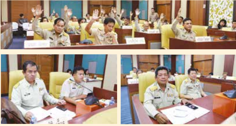
วันที่ 26 กรกฎาคม 2562 ประชุมสภาเทศบาล สมัยวิสามัญ สมัยที่ 2 ประจำปี 2562 ณ ห้องประชุมสภาเทศบาลนครศรี ❖