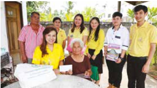
วันที่ 16 กันยายน 2562 ชุมชนโคกจัน และศรีตรัง