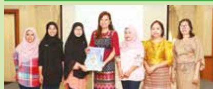
11 กันยายน 2562 คณะสันนิบาตเทศบาล จ.เพชรบูรณ์