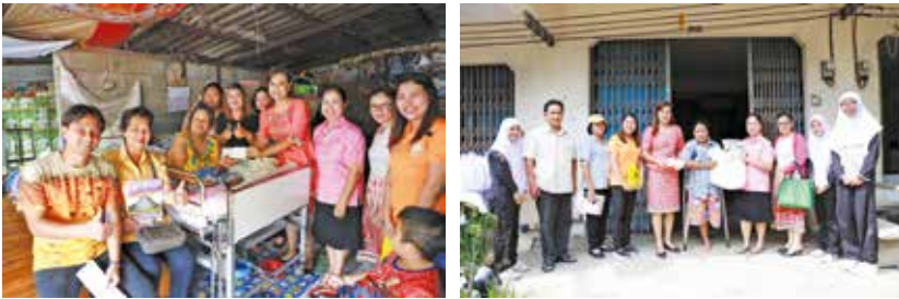
วันที่ 1 สิงหาคม 2562 ชุมชนนาตาล่วง ตรอกปลา และวิเศษกุล