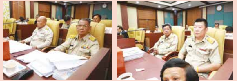
วันที่ 13 สิงหาคม 2562 ประชุมสภาเทศบาลนครศรี สมัยสามัญ สมัยที่ 3 ประจำปี 2562 ณ ห้องประชุมสภาเทศบาลนครศรี ❖