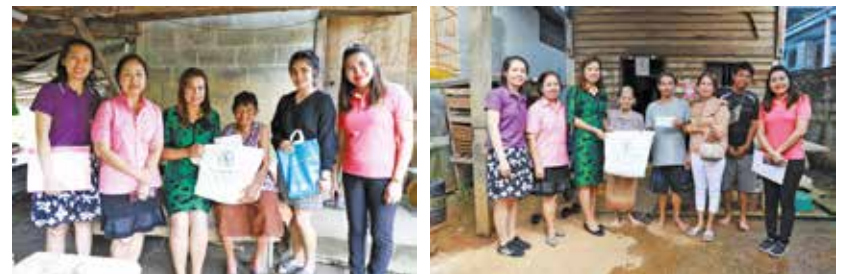
วันที่ 11 กันยายน 2562 ชุมชนกะพังสุรินทร์ 1 กะพังสุรินทร์ 2 และหลังควนหาญ