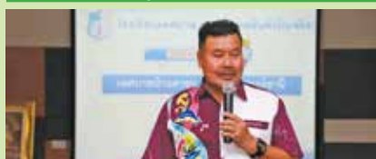
10 กันยายน 2562 เทศบาลตำบลยี่งอ จ.นราธิวาส