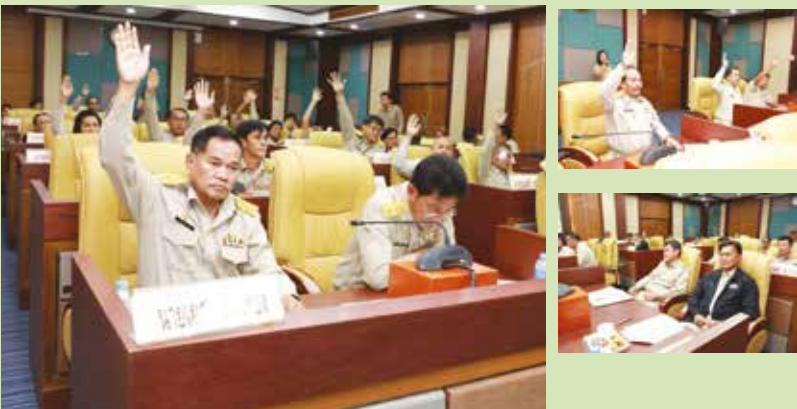
วันที่ 26 สิงหาคม 2562 ประชุมสภาเทศบาลนครศรี สมัยสามัญ สมัยที่ 3 ครั้งที่ 2 ประจำปี 2562 ❖