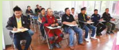
25 กรกฎาคม 2562 โรงพยาบาลนครศรีธรรมราช