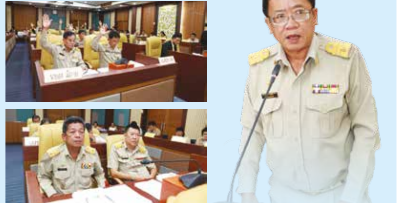
วันที่ 16 กันยายน 2562 ประชุมสภาเทศบาล สมัยสามัญ สมัยที่ 3 ครั้งที่ 3 ประจำปี 2562 ณ ห้องประชุมสภาเทศบาลนครศรี ❖