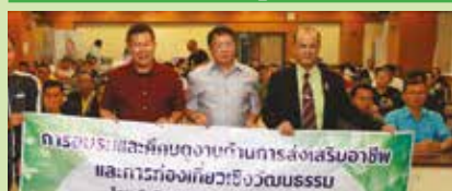
22 สิงหาคม 2562 คณะจากองค์การบริหารส่วน ตำบลทุ่งพอ จ.สงขลา