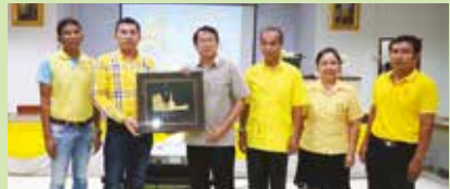
6 กันยายน 2562 เทศบาลตำบลท่าช้าง จ.สุราษฎร์ธานี