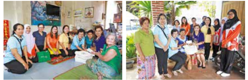
วันที่ 2 สิงหาคม 2562 ชุมชนสวนจันทร์ 1 - 5