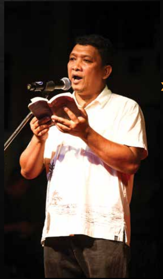
หนู มิเตอร์ ศิลปินนักร้อง