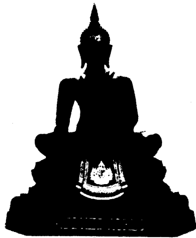
หน้าตัก ๕ นิ้ว