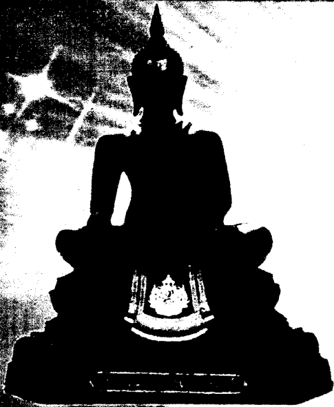
หน้าตัก ๙ นิ้ว

พระบาทสมเด็จพระบรมชนกาธิเบศร มหาภูมิพลอดุลยเดชมหาราช บรมนาถบพิตร เนื่องในโอกาสพระราชพิธีมหามงคลเฉลิมพระชนมพรรษา ครบ ๗ รอบ ๕ ธันวาคม ๒๕๕๕