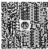
QR Code (Traffy Fondue)